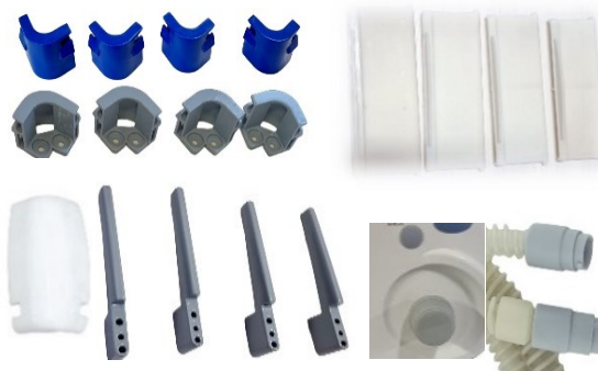
Imágenes: (esquineros para cunas, tapas para máquinas de anestesia, esquineros cunas, perillas monitores, conectores mangueras chalecos de percusión.

Contamos con un área especializada en diseño e impresión en 3D misma que nos apoya en la realización de refacciones y piezas de difícil acceso (por sus costos de importación o por su baja producción) y nos facilita el tiempo de respuesta para con los clientes.