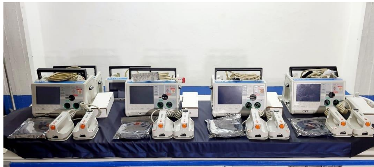
Desfibrilador ZOLL M series. ECG, Palas Rígidas $25,500.00

*Precios no incluyen IVA, ni gastos de envío